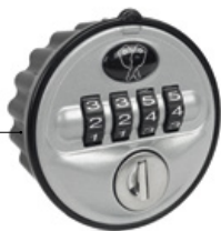
SERPOIGN/4CODE Pièce moulée en zinc avec façade en métal gris

La serrure à code est une alternative intéressante pour des utilisateurs temporaires. Une clé passe permet de retrouver un code en cas d'oubli, de déverrouiller la serrure et de réinitialiser le code.