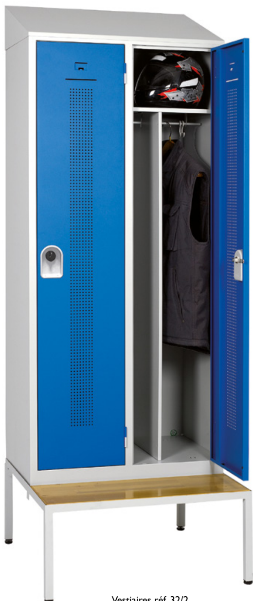
Vestiaires réf. 32/2 + coiffe réf. A33/80 + socle-banc réf. A30/80/B

La coiffe est un plan incliné à emboîter au dessus du vestiaire, qui empêche la pose d'objets, éliminant ainsi le risque de chutes accidentelles, et qui améliore les conditions d'hygiène.