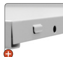
Installation simple des étagères sans taquet