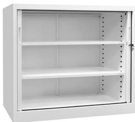
Accès et visibilité à 100%