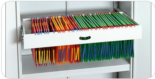
Tiroir Télescopique pour Dossiers Suspendus AR-ETT-001